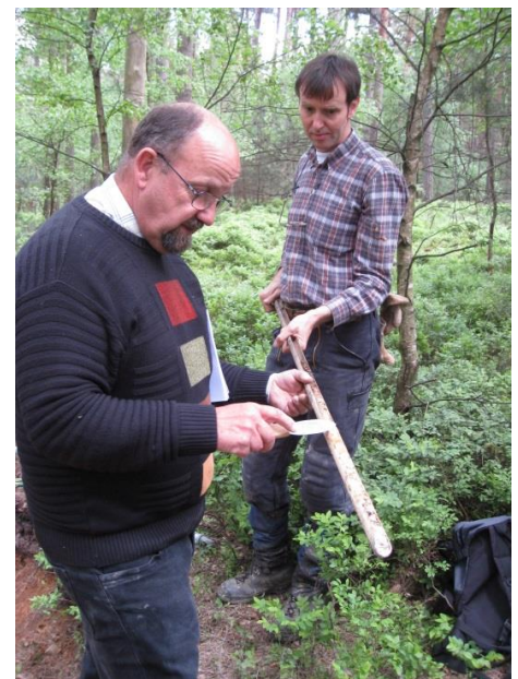
Beurteilung der Bodeneigenschaften durch den Geologischen Dienst NRW

Die Arbeiten sind Teil der forstlichen Standortkartierung, die vom Landesforstgesetz für sämtliche Wälder des Landes vorgeschrieben ist und seit vielen Jahren in Nordrhein-Westfalen durchgeführt wird.