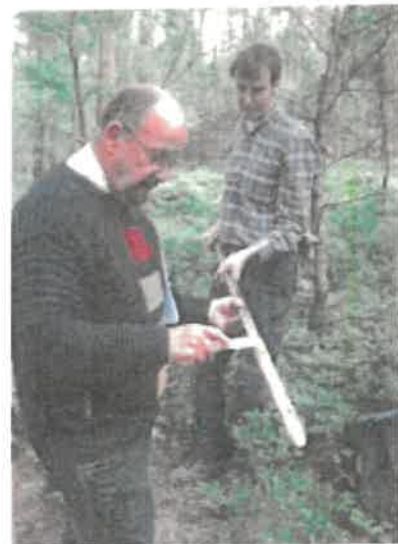
Beurteilung der Bodeneigenschaften durch den Geologischen Dienst NRW

Die Arbeiten sind Teil der forstlichen Standortkartierung, die vom Landesforstgesetz für sämtliche Wälder des Landes vorgeschrieben ist und seit vielen Jahren in Nordrhein-Westfalen durchgeführt wird.