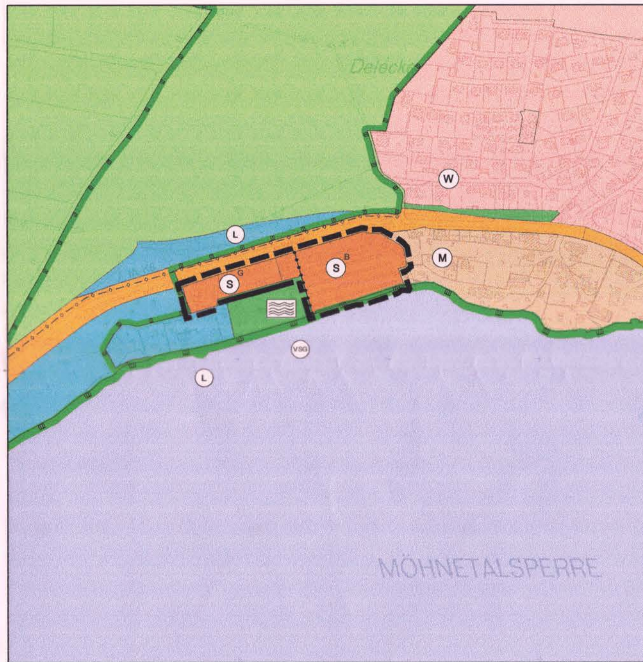
20. Änderung des Flächennutzungsplanes