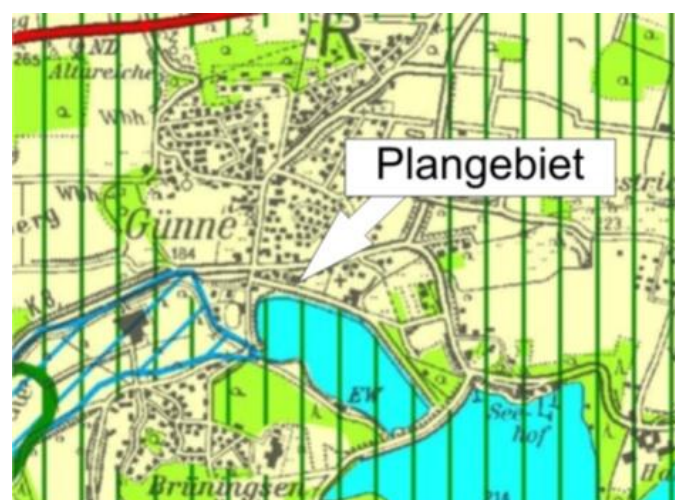
Auszug aus dem Regionalplan (ohne Maßstab)

Die bauliche Entwicklung hat sich danach an dem Bestand zu orientieren und den Bedarf der ansässigen Bevölkerung zu decken.