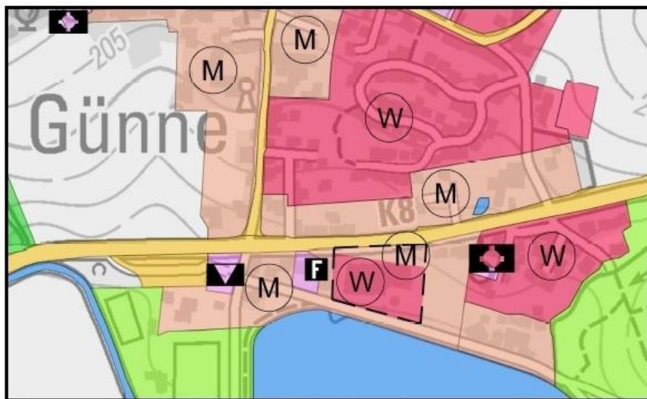
Auszug aus dem FNP nach der Berichtigung (ohne Maßstab)