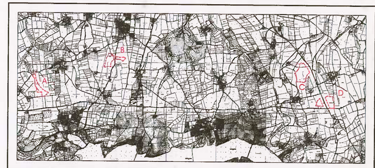
Übersichtsplan M 1:75000