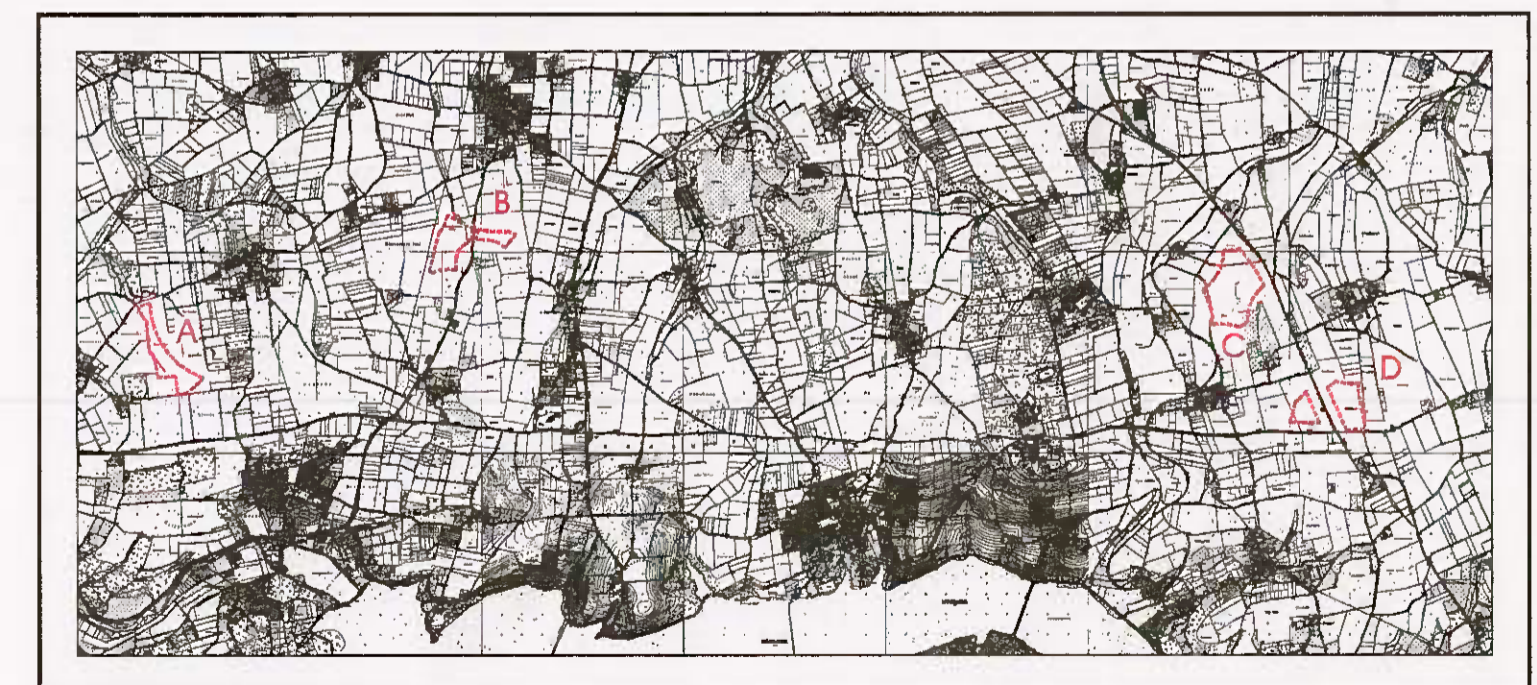
Übersichtsplan M 1:75000